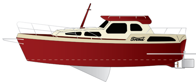
rzut z boku