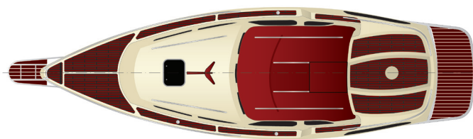
rzut z góry